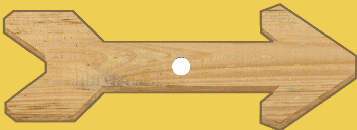
Flèche à coller sur du papier Canson et à découper